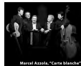
Marcel Azzola, "Carte blanche"