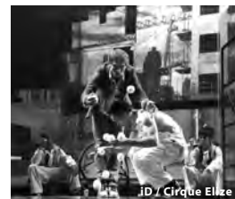
iD / Cirque Eloize