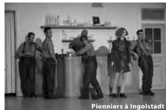
Pionniers à Ingolstadt